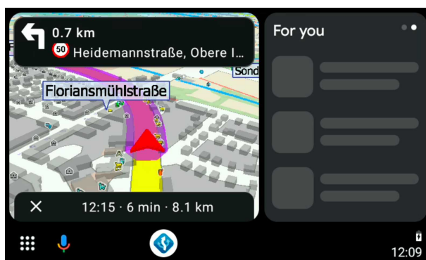
Navigator 7.3 auf Android Auto Fahrzeugbildschirm – Coolwalk UI